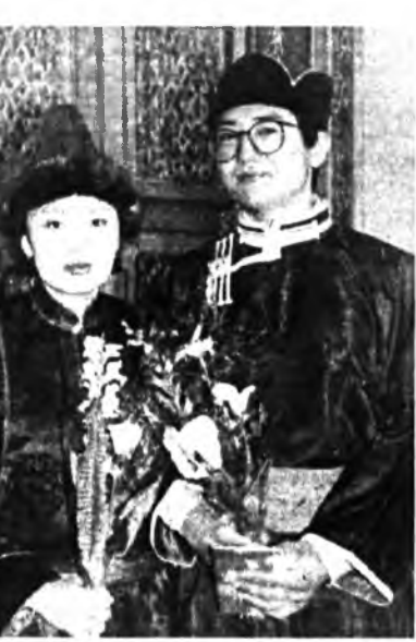
Буряад басаганнай Япон орондо суурхуулаар оролдоноб. Нүхэрэйнгөө дэмжэлгэ туһаламжаар хоёр хүүгэдэ һанаа амар орхёод ябанаб, - гэбэ.

Монгол уласай геологинн түб лабораторидо япон хэлэнэй оршуулагшаар 1994 он болотор ажаллаа. 1995 ондо Буряадан эхэ һургуулин Дорно Дахинэй һалбаридо 2000 он болотор япон хэлэнэй багшаар хүдэлһэн. 2001 онһоо Японой Оскын гадаада хэлэнэй эхэ һургуулида аспирантурада һуража байна. Тэрэниие дүүргэдэ буряад орондо япон хэлэ дэлгэрүүлэн заажа, тус хэлэ зааха һургуули эрхилжэ дуратайб гэжэ. Жиминь гуаһаа һуралсалайһи дунда хүнэр хүндэ асуудал тохёолдоногүй гү, хоёр хүүгэдэ һанана гүш гэжэ һураһани, абань үхибүүдэ һайнаар харадаг, гансал англи хэлэндэ хүнэрдэнэб, теэд энэ хүндэ байдалыс дабажа гарахаб гэжэ хэлэ. Эжынэ намтар гүүхыс эхэ һонирхожо, шудалжа байһаб. Буряадан ёһо заншал тухай номыетнай баһа япон хэлэн дээрэ гаргуула дуратайб. Буряад басаган хадаа япон гүрэндо Буряадынһаа нэрэ