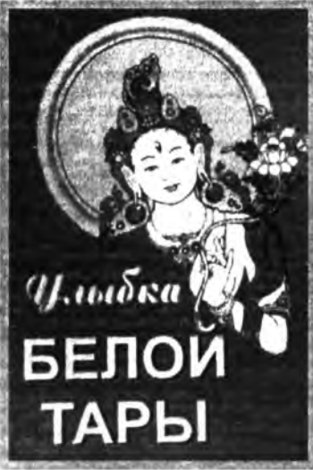
Цыбилжа БЕЛОЙ ТАРЫ