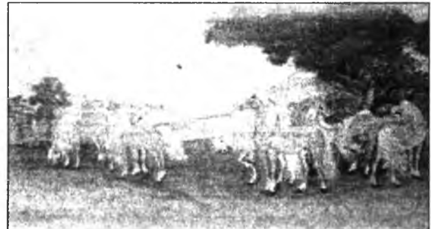
Эрэлхэг эхэнэр тухай домог

гутаахагүйб», - гэжэ найдуулба. Эсэгэ эхэ хоерынь үхинэй үгэ дуулга, ошохоб гэжэ шнидэбэ, маанадай оролсожо худхууланай хэрэггүй гэжэ бодобшы, һанаа амар байха аргагүй болобо. Солбойной туяа бадаржа, үр сайхын урдахана, газарһаань тоншобо. «Бидэнэр ябахамнай» гэжэ абяа гарахадань, эсэгэ түргэн бодожэ газар гараба. Хонгор Зула хэдхэдэ хубсалһан юм, номо һаадаг абаад гараба. Эсэгынгээ хажууда ошоожэ зогсоод: «Би эсэгынгээ орондо таагнады дахуулаад ошохомни», - гэжэ шангаһанаар захиран хэлэхэдэн, ерэнн хүүбүүдэй наада барин энсэдэхэ хэбэртэй аашалахадань, Хонгор Зула эсэгэ тээшэ хаража: «Зай эсэгэмни, би танай нэрэ хухалхагүйб, хэрэгштынэй дүүрэн бүтээхэб, та нялха дүүемни һайнаар үргэжэ тэжээгйт», - гэжэ хэлээд, богоолойног моринынь асарһан байхадань, ута жада баринхай,