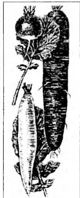
Сорта редиса (сверху вниз): красный с белым кончиком; красный великан; ледяная сосулька.

Редис - самая скороспелая корнеплодная культура. Ранние сорта готовы к уборке через 18-25, а поздние - через 40-45 дней после всходов. Пищевая ценность культуры определяется содержанием легкоусвояемых минеральных солей и витаминов. Острый вкус редиса способствует повышению аппетита и улучшению пищеварения, поэтому особенно сказывается на состоянии здоровья человека. В нем есть танин, рибофлавин, никотиновая кислота, эфирные масла, обладающие бактерицидными свойствами. Редис (корнеплоды и свежие листья) используется в свежем виде, в том числе и в виде сока, который следует принимать в сочетании с соком других овощей, в частности, с морковным.