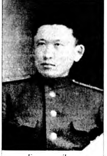
Гончиков Дугаржан Жалсарнай Сүрхэйгээ албанай эхиндэ

буудалдаа в болошобо. Тэрелхэ зон тэрелхэ, шархатаһан, адууланшые зон бшн хэбэртэй. Мэдэг абгай түргэн морёо тэргэһэнь мулталаад лэ, дүүгэйнгээ Цырен хүбүүе хормой дороо оруулаад, үндэр гэгшын ногоон соо удаан хэбтэбэ ха. Абяанай замхахата, һэмээхэн бодожо, морёо тэргэдээ оруулба. Маани мэгзэмээ уншажа, гэдэргэнь морёо залажа, һүниин харахыда һөөргөлбэ. Хооһон модон тэргын хонироондо дэгэлэйн карманда байһан «импералнуудын»