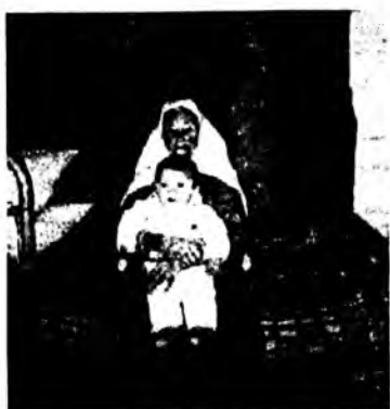
чабанкой... Куда только ее не направляли!