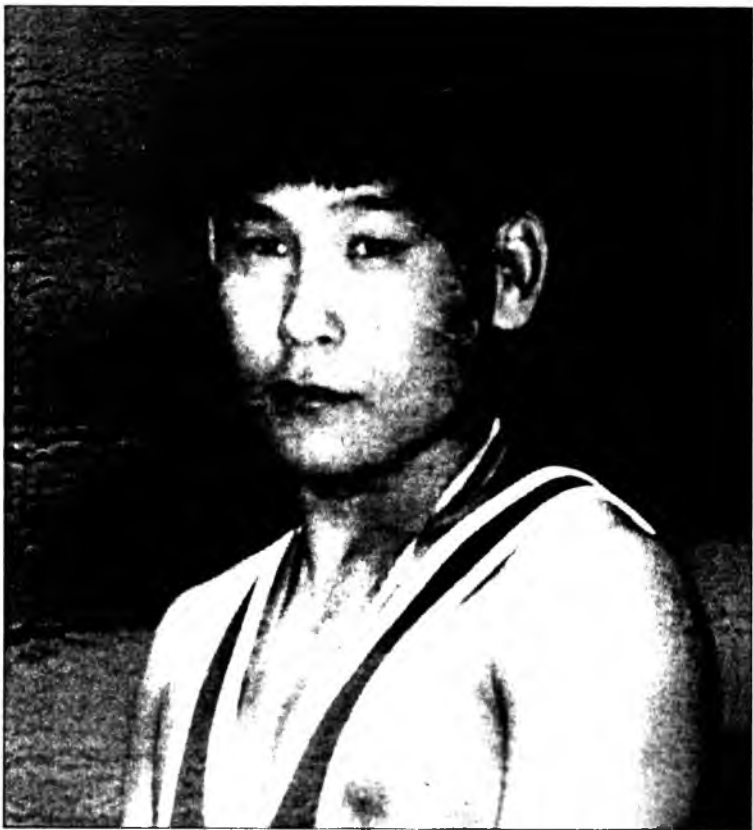
Мурьсөөнэй эрхим барилдааша, Россин чемпион Базар Базаргуруев