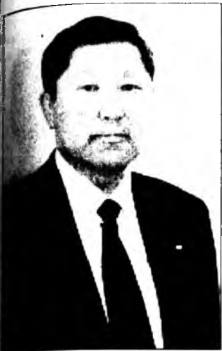
Уважаемые жители Бурятии!

23 июня состоятся выборы Президента Республики Бурятия, на которые я решил выдвинуть свою кандидатуру.