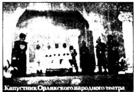
Капустник Орликского народного театра