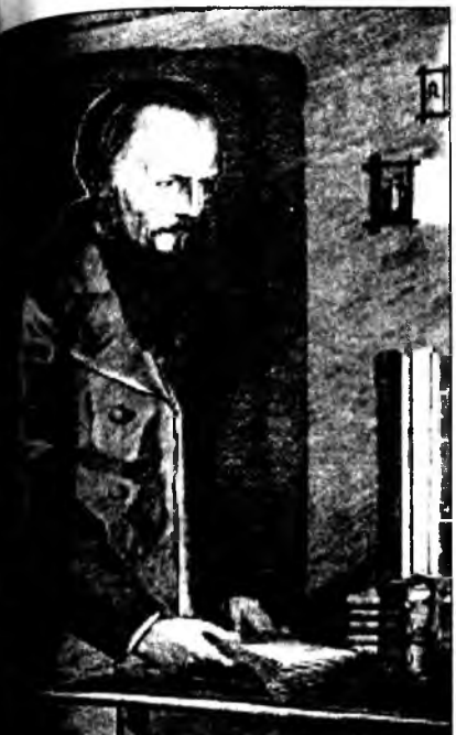
Пүтгэхэл. Эхининь апрелин 18-май 16, 30-най дугаарнуудта.

ажамидаралһаа үшөөл дээгүүр. Эрдэм манда бэлгэ бэлиг олгохо, бэлгэ бэлигээр хуули журамай ёһо гурим ойлгохобди. Хуули журам ёһо туйлаалга ямар баяр баясхаланһаа үлэмжэ дээгүүр». Иигэжэ тэдэ сэсэрхээд, өөр