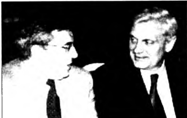
театрнуудай фестиваль гэшэ хадаа үндэр хэмжээндэ үнгэргэгдэһэн байна гэжэ