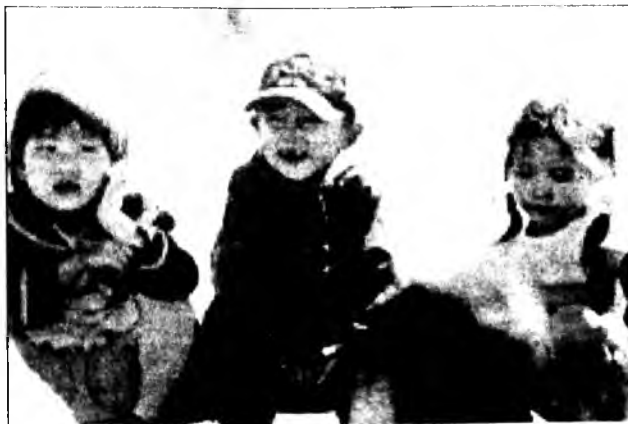
Буряад хэлэ бэшгэй дүрим хүүлшынхнээ 1961 ондо шэнэлэгдэж, республикын Верховно Советэй тогтоолоор баталагдана байна. Тэрэ үеһөө нилээд олон жэл үнгэрөө.

Тус дүрим дээрэ үндэлжэ, олон тоото уран найханай зохёолнууд бэшгэдэ, нийтэ-политическэ, эрдэм дэлгэрүүлгын, хуралсалай номууд (буряад хэлээр, мүн бусадшые предметүүдээр), тухэл бүрийн словарьнууд хэблэгдэж, республикын болон нютагуудай сонинууд хэблэгдэжэ гарана. Энэ хугасаа соо хэлэнэй дүримүүд яһала үргэнөөр хэрэглэгдэжэ, заншанги болоо, тогтонжоо, тиймэһээ тэрэннээ эрид хубилгаха шалтаган үгы байбашые, зарим тэды заһабари, нэмэлтэнүүдые оруулхаар болоо гэжэ ханагдана. Иймэ бодол хэлэ шэнжэлэгшэдэй, дунда болон дээдэ хургуулин багшанарай, мүн юрын зонойшые дунда байн- байн түрэдэг болонхой.