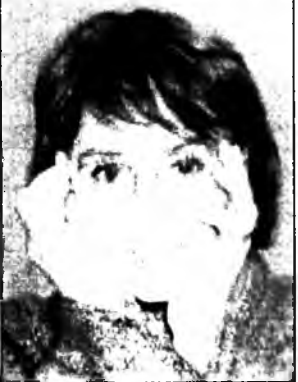
концертдэ уригдан орохо болобо. 5 жүжгшэднэй энэ түгэхэлэй нааданда уригдажа, Эрхүү хотодо үлэшэбэ. Харин бэшэ жүжгшэд театрай ажалшад майн 26-да эхэн ажал

Энэ «Сибирский транзит» гэхэн фестивалда Сибирин Федеральна округон областнуудан гол драмын театрнууд бэшэ бага ехөгүн хотонуудан театрнууд шэлэжэ ороод, аяр 26 театрнуудан коллективүүд бэлэг шадабария арган хоногон хугасаа соо харуулжа заяатай байба. Эдэ олон театрнууд соо драмын 4 академическэ театрнуудан коллективүүд хабаадалса. Тоолохо болобол, манай Хоца Намсараевай нэрэмжэтэ буряад драмын театр, Омск хотын академическэ театр, тинхэдэ Новосибирскын «Красный факел», Эрхүүгэй Н.Охлопковой нэрэмжэтэ академическэ театрнууд болоод, бэшэ бэлэгтэй жэжэ, томо театрнууд хабаадалсаба.