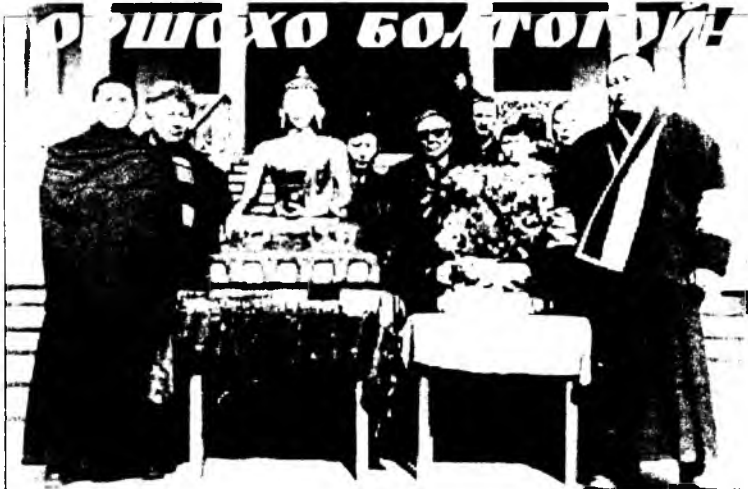
«Буряад орон дотор бурхан шажанай дэлгэрхэ хэрэгтэ Ононой эрьеин хамниган дасангуудай үүргэ тон ехэ юм», — гэж, Хориин тайшаа Тобойн Түгэдэр түүхэ бэшгэ соогоо бэшэһэн байдаг. Тэдэнэй нэгэн Гүнэйн дасан байгша оной сентябрь соо 200 жэлэйнгээ ой тэмдгэлэхээс байна.

Дасанай ойн баярай найр үнгэргэхын тула нютаг зон, мүн агынхид бэлэдхэлэй элдэб хэмжээнүүдые ябуулжа эхилэнхэй. Дасанай түүхээр шэнжэлгэнүүд хэгдэжэ, газетэдэ статьянууд толилогдоно. Тэрэнэй хажуугаар тус дасанай жиндагуудай дуида бадар суглуулха ажал эдэбхижээ. Тийхэдэ Гүнэйн дасанай фото-зурагтай монголлитэ хэблэгдэжэ, айл бүхэндэ тараагдаа. Хамбын хүрээндэ томо Будда бурханай, мүн Чойжол сахюу-сагай дүрэнүүд захяагаар бүтээгдэжэ, Гүнэй руу энэ хабартаа залагдаа нэн.