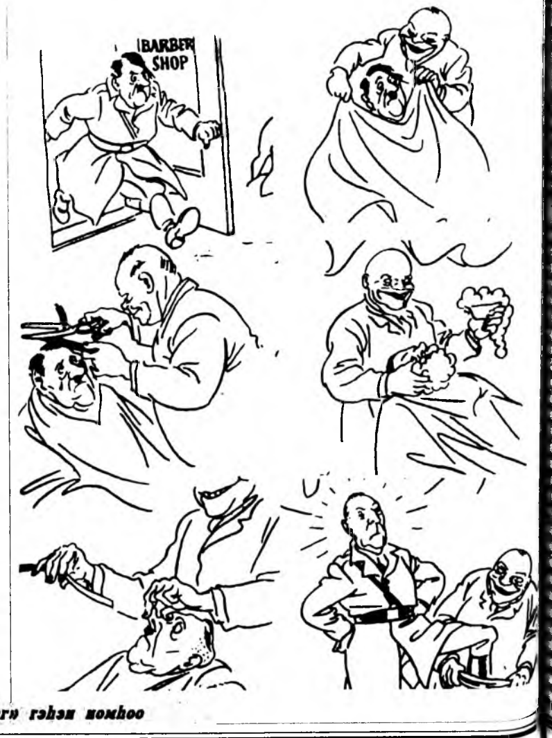
«Шөг зураг» гэхэн номһоо