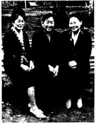
1955-1957 онуудта Захаминай аймагай болон Горокок хотын прокуророор ажаллаба. Тинхэдээ вольфрам-молибденэй комбинадта хуули сахилгые, ажалай журамые шагнагдаха ябадалда, мүн эдэе хоолой болон түүхэй эд болбосоруулгын промышленностиин продукция бүрин бүтэн байлга, шанарта анхарал хандуулдаг байгаа.