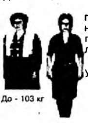
До - 103 кг После - 60 кг.

Акупунктурное программирование (АП) - это синтез современной психотерапии и рефлексотерапии. Его не стоит путать с кодированием, гипнозом, традиционным иглоукальванием. АП - самостоятельный, научно обоснованный лечебный метод (патент РФ на изобретение № 2099096), автор которого известный петербургский врач-психотерапевт, рефлексотерапевт, нарколог - С.П. Семенов. Более чем 20-летний опыт применения этого метода убедительно доказал его высокую эффективность. Примечательно, что при алкоголизме, табакокурении, а также при ожирении АП позволяет достичь положительных результатов всего за один сеанс.