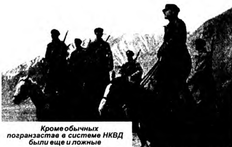
Кроме обычных погранзасти в системе НКВД были еще и ложные