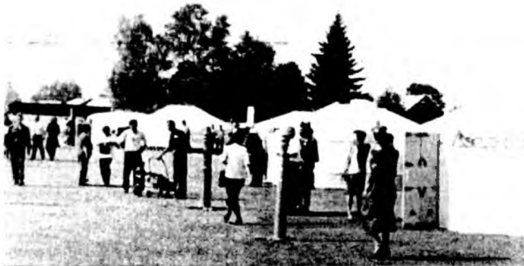
Гостей встречали в юртах

Мощный всплеск народной волны и всеобщая активность показали, что настало время возродить забытые традиции, культуру, язык и дух народа, понять, что мы не сплошная серая масса, изучить, осознать свои корни с тем, чтобы наравне с другими этносами идти в будущее. Тем более это важно, потому что хонгодорский регион в научном отношении самый малоизученный, - говорит поэт Лопсон Тапхаев.