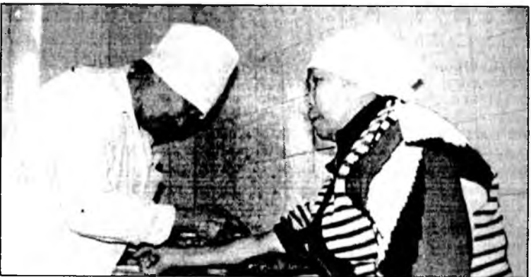
Ээлжээтэ тарилгаа абая даа...