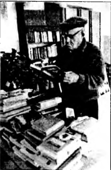
Һүүлэй үедэ библиотекэдэ уншагшад олошороо.