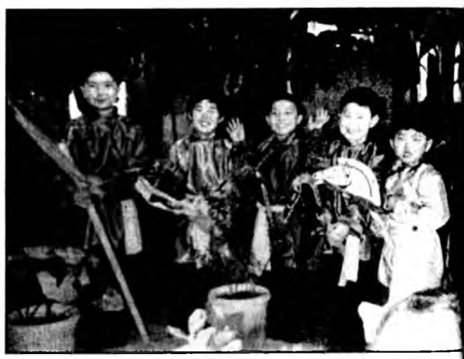
Детский фольклорный коллектив «СЭРГЭ» приглашает с 5 до 12 лет.

Мэри ХАМУШИ кандидат филологических наук.