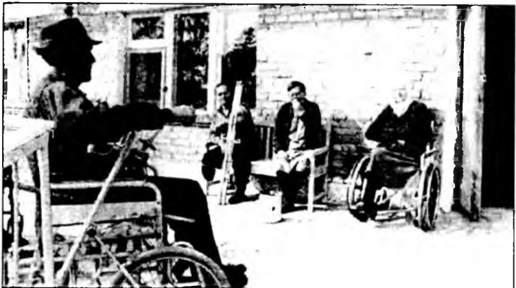
Наранай дулаахан туяа дорю аалин барангаа зугаалхамнай гү?