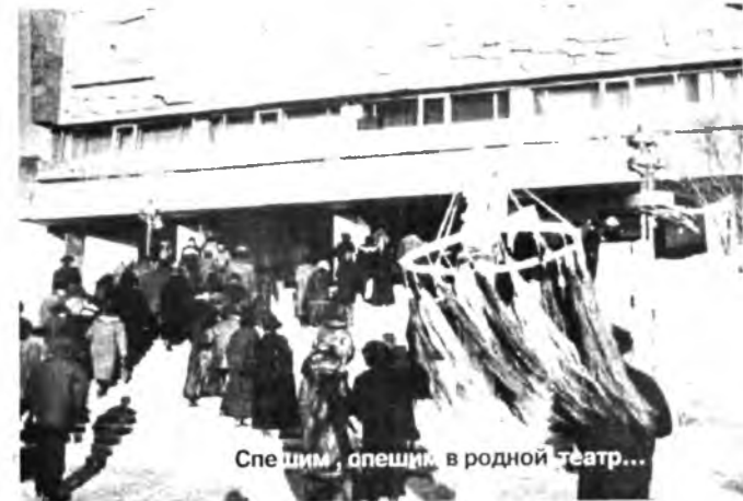
Спешим, опешим, в родной театр...

ходится нашим талантливым артистам ездить на гастроли с протянутой рукой.