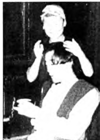
«Васса Железнова» - шээ халаан