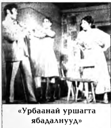
«Урбаанай уршагта ябадалнууд»