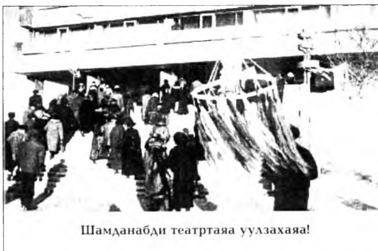
Шамданабди театргаяа уулзахаая!