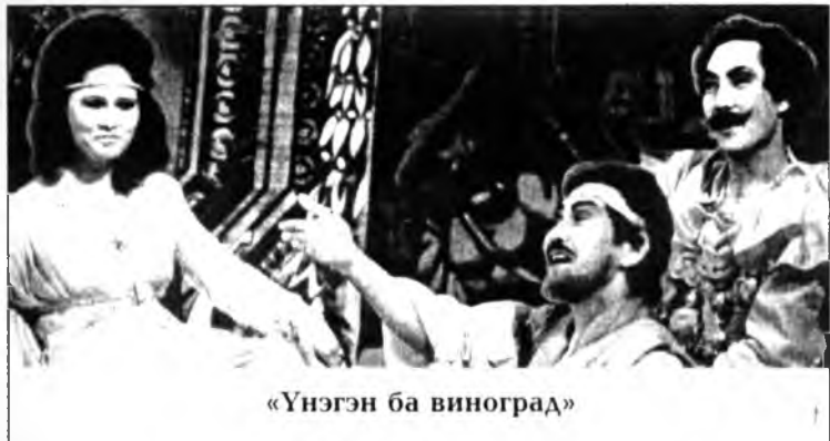
«Үнэгэн ба виноград»