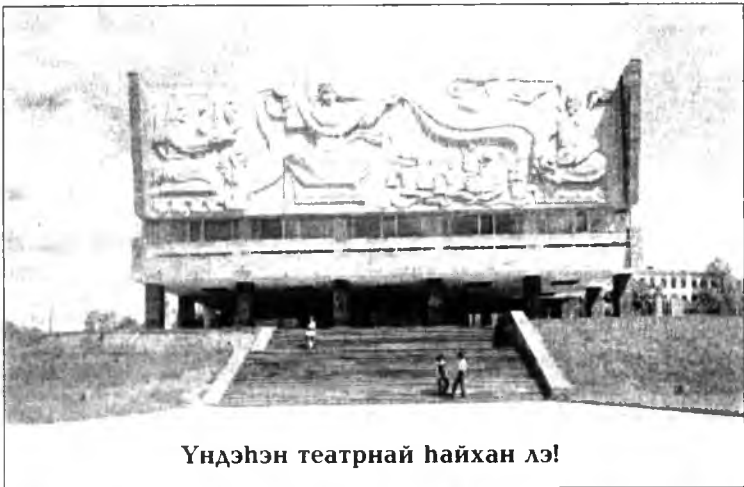
Үндэһэн театрнай һайхан лэ!

Ямаршые хүн һайхан юумэндэ, гэгээн һайханда гээд тобшолое, дуратай байдаг, тэрээндэ этигэдэг, шүтэдэг гээшэ. Гансал ялагар гоё газар түхэлһөө гадна доторой утаһан, гүнзэги бодомжо хэрэгтэй. Иигээд бодоод үзэхэ болоо һаа, театр гээшэмнай эдэ хоёр ойлгосо нэгэдүүлэн, манда бодото жэшээ боложо, юрын бэшэ юртэмсэдэ хайшан гэжэ ажаһууһаб, бээ хүмүүжүүлхэб гэжэ хурган.