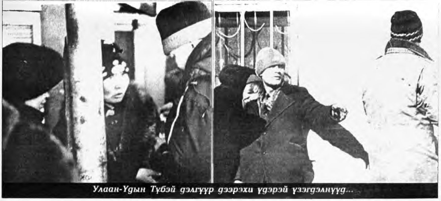
Улаан-Үдэ Түбэй дэлгүүр дээрхи үгээрэй үзэгдэлнүүд...

Республикымнай үндэр наһатай бүхы хүнүүд энэ асуудал шидхэхын тула саг үргэжэ эригшгэнээр хүдэлжэ ёһотой гэжэ Буряад Республикын Президентын дэргэдэхи Старейшиннүүдэй Советтэ маанадта мэдэгсэнэ. Тинмэһээ, хүн зонгэй уншагшаг, ханаань аюулнуудай, хүсэлтнүүдтэ, дуралхануудта редакцияга эмгэжэ байгнат.