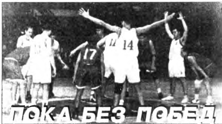
ПОКА БЕЗ ПОБЕД