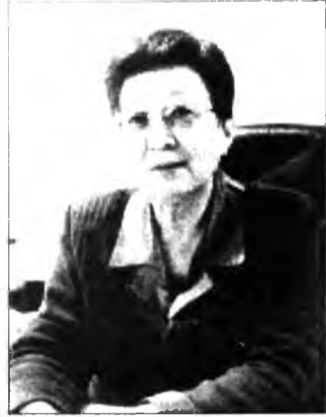
Энэһинээ гаргашануудын хороогдохо юм.