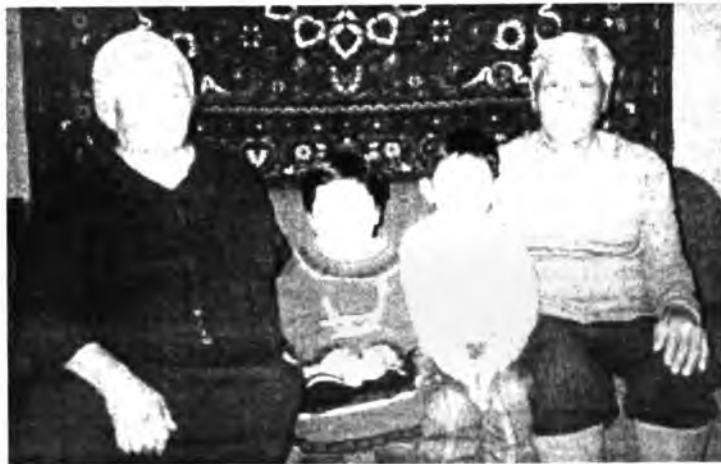
Удаан танинем дурсажа, ханажа ябах Ухаатай сэсэн табисууртай нютаг зонтойла. Огторгойн үндэрһөө мүшэн болоод яларха Одон шэнги дээдын харуул золтойла.