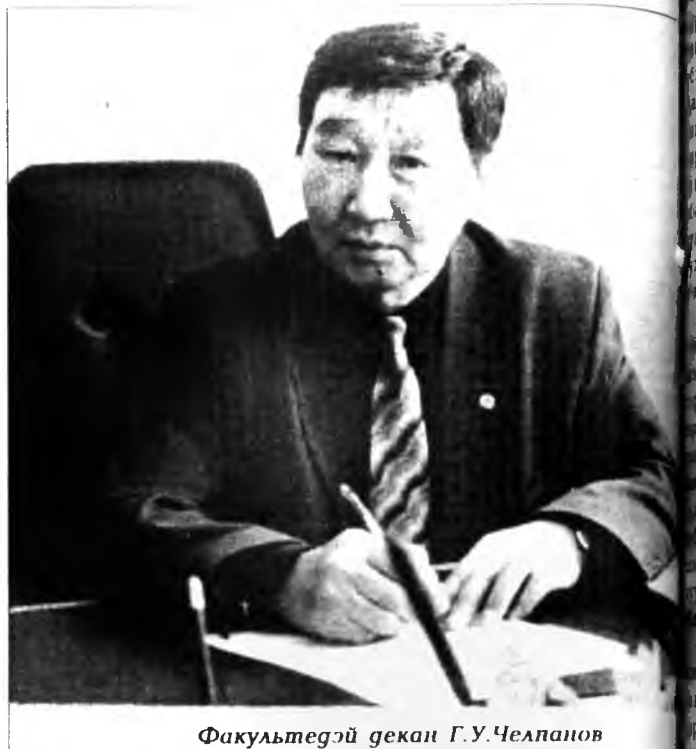
Факультедэй декан Г.У.Челпанов

Энэл жэл түрүүшын 50 агрономууд мэргэжэл шудалжа гараа һэн. Энэ ушараар республикын засаг түрэ түрүүшын мэргэжэлтэдые,