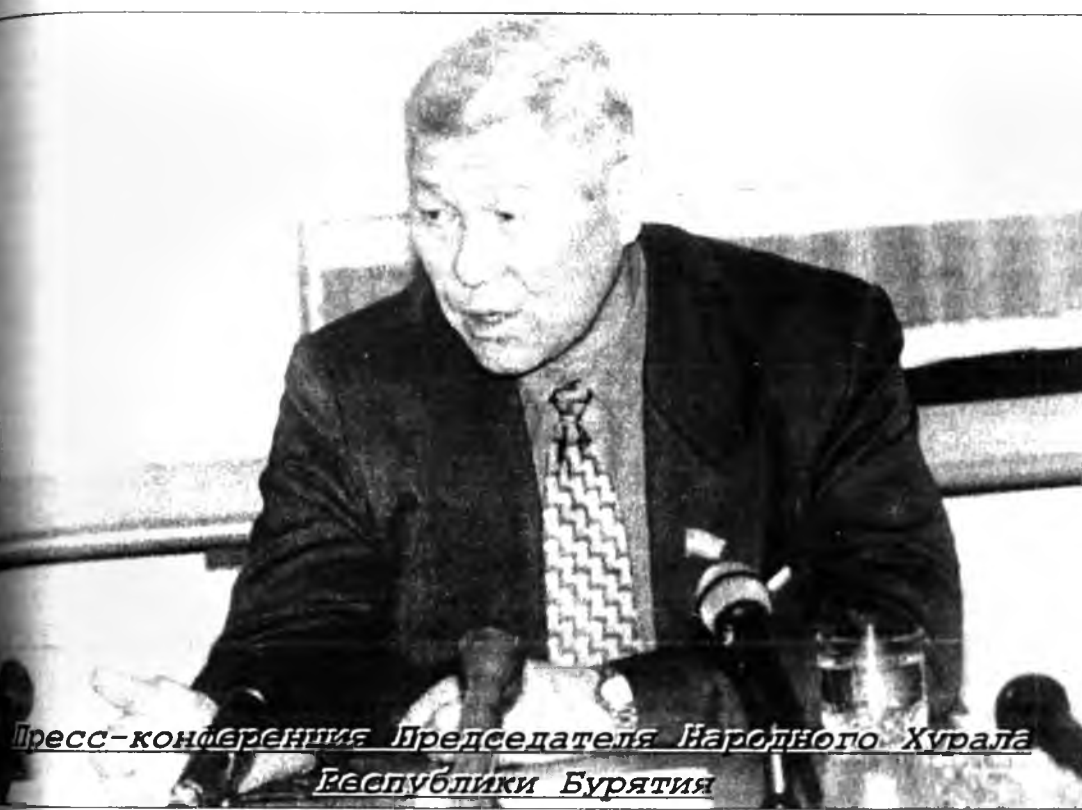
Пресс-конференция Председателя Народного Хурала Республики Бурятия