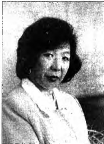
Глава 4. УКРАШЕНИЯ

Украшения - зүждэл, гоёолто - сьемное подвижное убранство из постоянных или проходящих материалов - в отличие от неподвижных украшающих элементов, таких как разрисовка и деформирование тела, татуировка или укладывание волос.