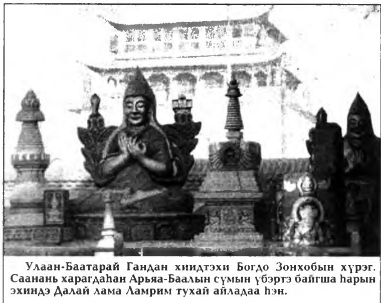
Улаан-Баатарай Гандан хиидтэхи Богдо Зонхобын хүрэг. Саанань харагдаһан Арья-Баалын сүмэн үбэртэ байгша харын эхиндэ Далай лама Ламрим тухай айладаа нэн.

МЯНГАН ЗУЛЫН ҺАЙНДЭР Ноябрийн 28-29-30-да Ивалгын Хамбын дасан болон Дээдэ-Онгостойн Хамбын Хүрэн түрүүтэй Россин Буддын шажанай Заншалта Сангхын дасангуудта Зула хурал үнгэргэгдэһэн. Зула хурал Буддын шажанай Гэлүгба шэглэлэй үндэһэ һуури табигша Богдо Зонхобын түбэд- монгол литээр үбэлэй эхин харын 25- тагаалал болоһон ушарта зорюулагданхай харын литын 25-най үдэр байгша ноябрийн 29-дэ тудана, Тиймэһэ энэ үдэр хурал үнгэрхэ.