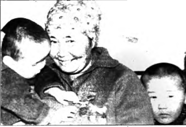
Доржо Эрхэтуевичай бүлэ тухай документальна фильм буулагданан байха юм.

Минии нарай няха үхиүүд найхада, ажалай герой Ондэн-