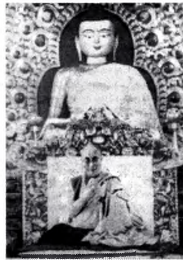
Дээдэ Боди сэдхэлдэ зорюудаг. Удаань Дүрбэн Саглашагүйе уншадаг.

Эдэ үдэрнүүдтэ масаг барижа, гансал сай уудаг. Тиин маанида һуугша хүн өөрыгөө энэрхы сэдхэлтэй Арьяа-Баала бурхан гэжэ бисалгаад, долоон үетэ зальбарал уншахадаа, лама багшанарайнгаа урда һунажа мүргэдэг, үгэлиг үргэл бодотоор болон сэдхэлээрээ баридаг, энэ болон урда түрэлнүүдтэ хэһэн нүгэл хилэнсээ наманшалжа, шатаал хаа, дабтахагүйб гэжэ тангаригладаг, хамаг амитанай, Бурхад, бодисаданарай буянгы даган баясадаг, бидэнэй туһын тула Номын хүрдэ эрьюулан, сансарын барагдан үнгэртэр энэ орондо оршон соёрхо гэжэ багшанараа гуйдаг, хамаг буянгаа