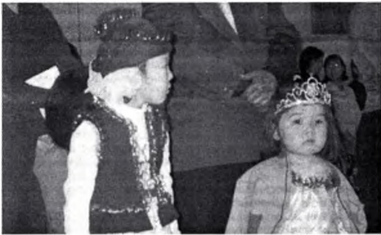
шууяатай, хүхюүтэй даа...