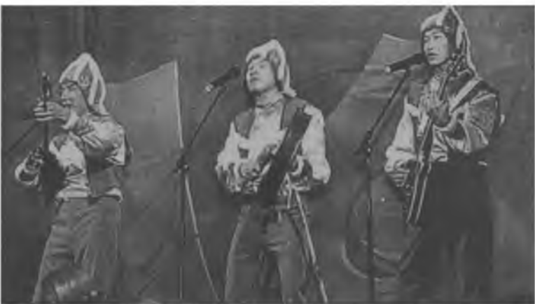
«Тала» бүлэг (Алтай)

«Сагаан Һарын мунгэн толон мангаа эрьеэд, Сэдьхэл зүрхэ сэлмэг болгон хүгжэм жэргээ. Һаруул, уужам түби гэлхэй Һэргээ Һараар, шэнээр шэртээ Шэди хүсэ, шнаг гура мангаа сүршөө.