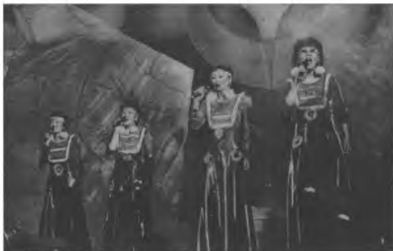
«Осикта» бүлэг (Буряад Республика)