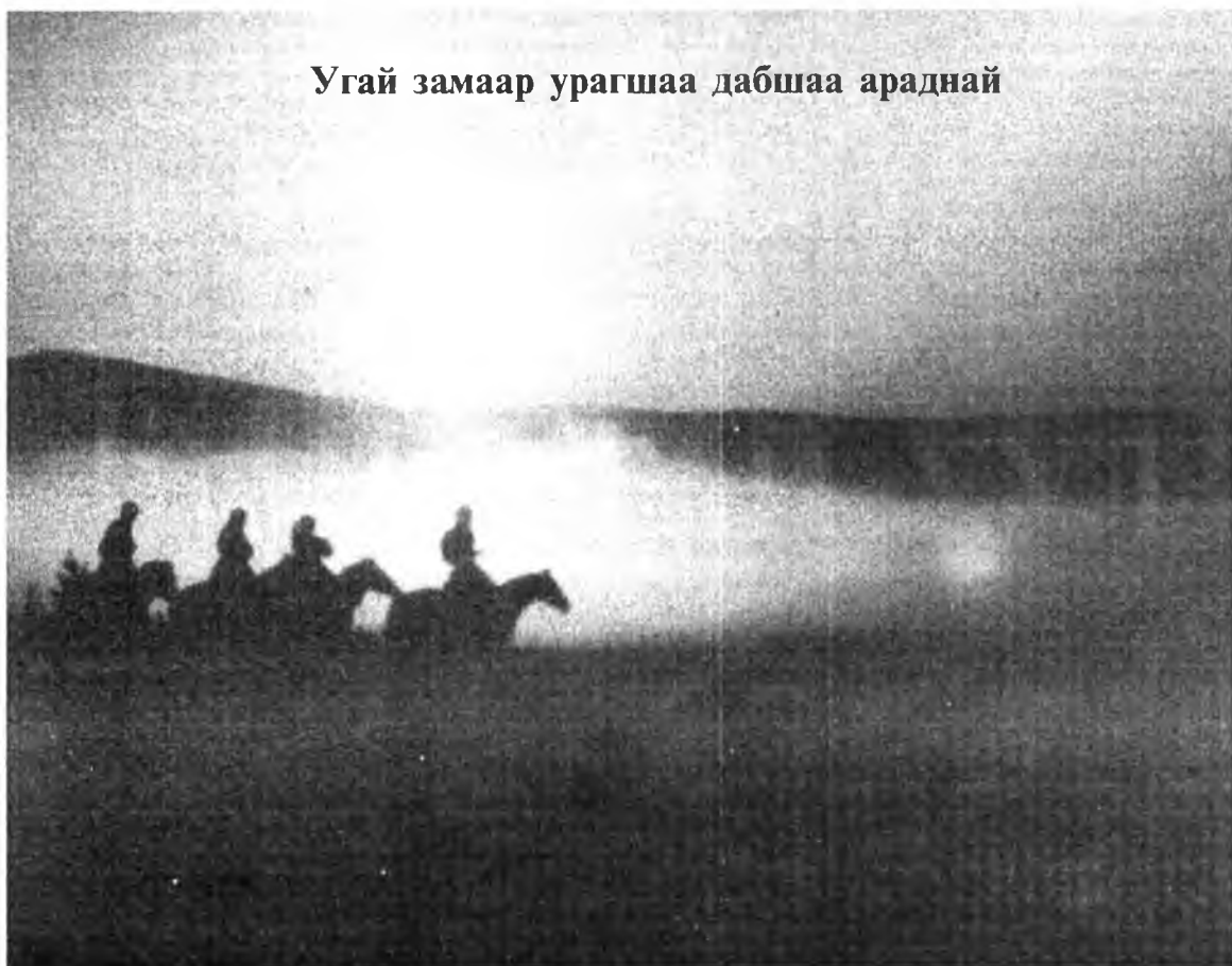
Угай замаар урагшаа дабшаа араднэй