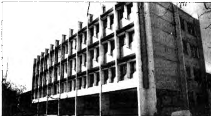
1-дэхи хабсаргалта Буряад Республикын Правительствын 2003 оной мартын 14-нэй 93-дахи дугаарай Тогтоолоор баталагдаа

Буряад Республикын Президент-Правительствын Түрүүлэгшэ А.В.ПОТАПОВ.