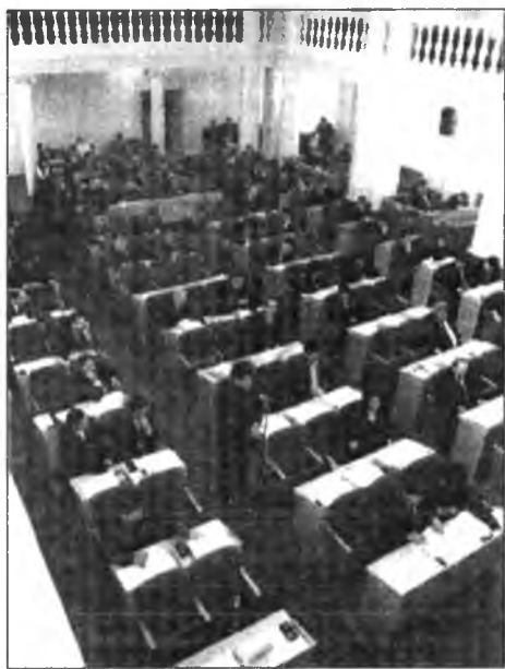
1. «Экономикын дэбжэлтэһээ - тогтууритай хүгжэлтэ хүрэтэр» гэһэн эрхэ түлөөлэгээнүүдэйн болзорто Буряад Республикын Правительствоын ажал ябуулгын программые анхарадаа абха.