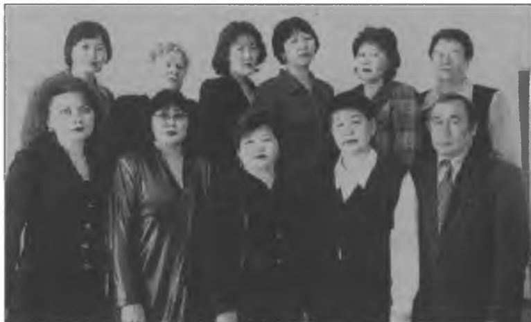
Кафедра гуманитарного цикла