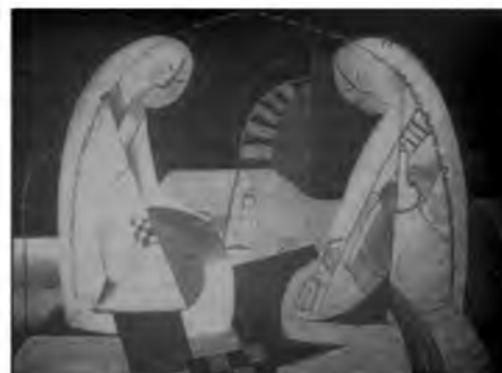
Рис. Ю. Мандаганова

По дому сон из детства бродит И колыбельной песней бредит.