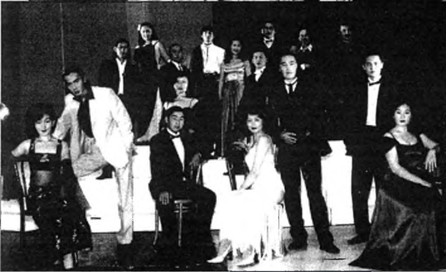
Буряад театрай 100 жэлэй оёе угтаха залуу халаан