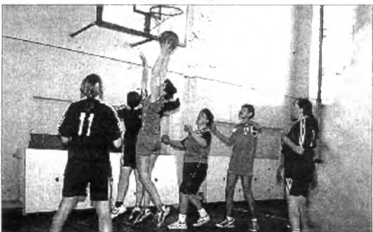
Спортивная жизнь колледжа