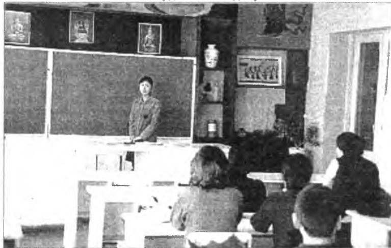
Урок в кабинете бурятской национальной культуры