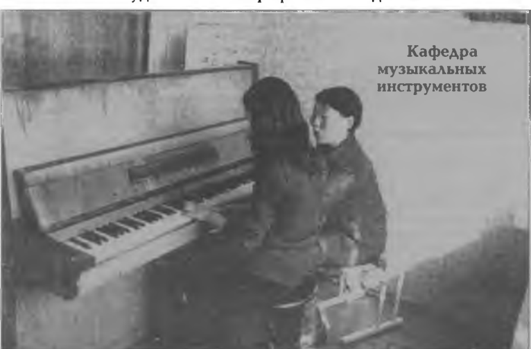
Кафедра музыкальных инструментов