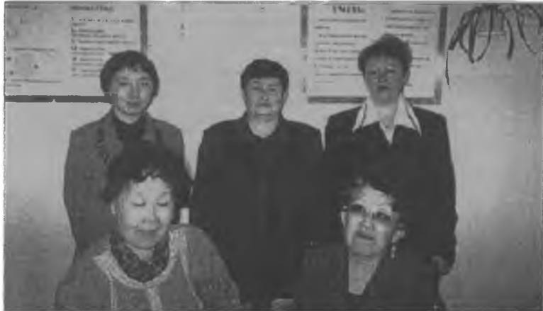
Кафедра естественно-математического цикла