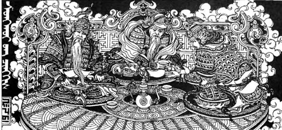
Ч.Шенхоров. «Абай Гэсэр Богдо хаан» сериһээ. «Гурбан тэнгэрийн уулзалга».

Буряад Республикын габьяата уран зурааша, Буряад Республикын гүрэнэй шангай лауреат, Буряадай арадай уран зурааша, Россин Уран зураашадай холбооной гэшүүн, Россин габьяата уран зурааша Чингиз Бадмаевич Шенхоровой хээн, бүтээһэн ажалынь бэшэхэ болооһаа, дүүрэн, дундаршагүй байха. Энэ хүмнай Түнхэнэй аймагай Далахай хууринда 1948 ондо түрэнһэн намтаргай. Ямаршье хүн хургуулида ороогүй һанаандаа, буруутай бэлшээрһээ гараагүй ябахандаа, нютагаа шэртэн харахадаа, энэ хада боориимнай саана хүхэ тэнгэрийнэй дээшэ юун байдаг юм гээд лэ, эхэ эсэгһэнь хуража халадаггүйл. Тиймэл ха юм даа. Далахай нютаг тэрэ сагтаа эхин классай хургуулитай, багахан нютаг байгаал ааб даа. Тиин Чингиз Түнхэнэйнгөө аймагта суутай Тора нютагай дунда хургуули дүүргээд, 1966 ондо Зүүн Сибириин технологическа институтда амжалттайгаар хуража байгараа орхёод, 1969 ондо Эрхүүгэй уран зурагай училищанда оролой... һүбэлгэн хүлэһимнай өөрын охи тоониний бусалжа, институт, училищини хуралсалынь хүмүүжүүлгы багашаага юм гү, нэгэ мэдэхэдэ, Эрхүүгэй самолётто хуужа абаад лэ,