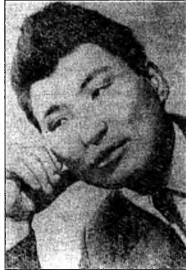
Дүлэн шэнги шухатай, Уршалаатаһан уураг тархитай,

Зүгөөр Би – богос бэшэб. Зүбшөөхэ ухаан, Уярха сэдхэл зүрхэтэйб. Дүрбэн мүсэтэ Араата амитаншье бэшэб, –