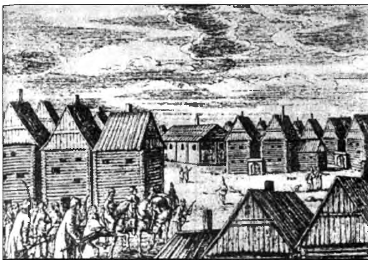
Вид Москвы в XVII веке (из книги немецкого путешественника Адама Олеария)

«Курса Русской истории» Ключевского князь Александр Невский упоминается 10 (десять!) раз в 10 (десяти!) строчках! И - все.