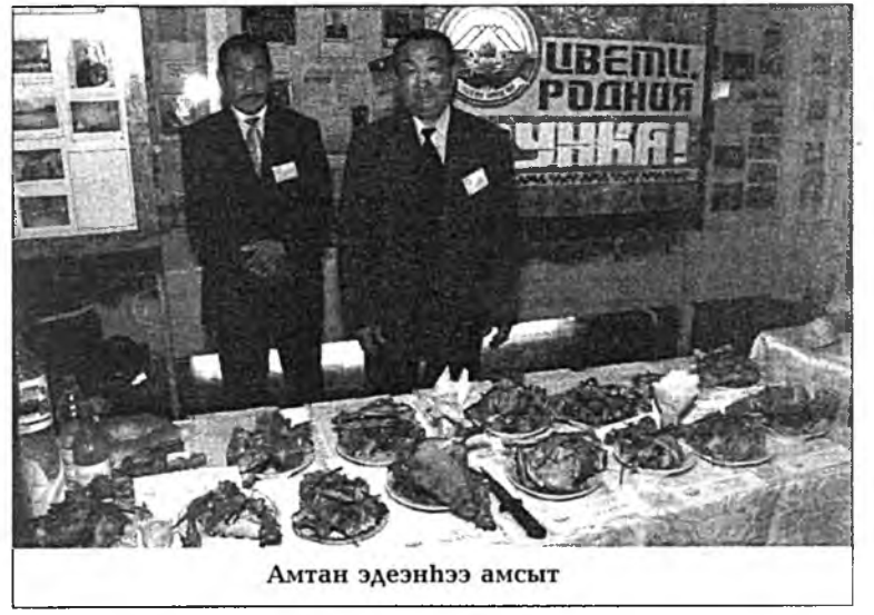
Амтан эдээнһээ амсыт

«Мельник» гэхэн үмсын предпритийн буйлуулһан һүн, ааруул, эзэгэй болон бусадшы эдэе хоолой олон зүйл анхарал татана. И.А.Мельнигэй толгойлдог энэ предпритийн бүридэлдэ һүнэй завод, гахайн фермэ, бага тээрмэ, Хэрэн ба Түнхэн хууринуудта универмагууд ородог. Гадна «Сибиряк» гэхэн хүдөө ажахын үйлдбэрийн кооперативай найдамтай