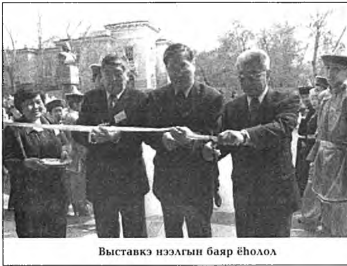
Выставка нээлгын баяр ёһолол

Театрай ордон соо аймагай предпритий болон ажахынуудай, хубийн ажахы болон кооперативуудай, «Аршаан» курорттын болон Нилова Пустынэ эмшэлгын газарай ажал хэрэг тухай хөөрэнэн, бүтээнэн продукцие харуулан үргэн выставкэ