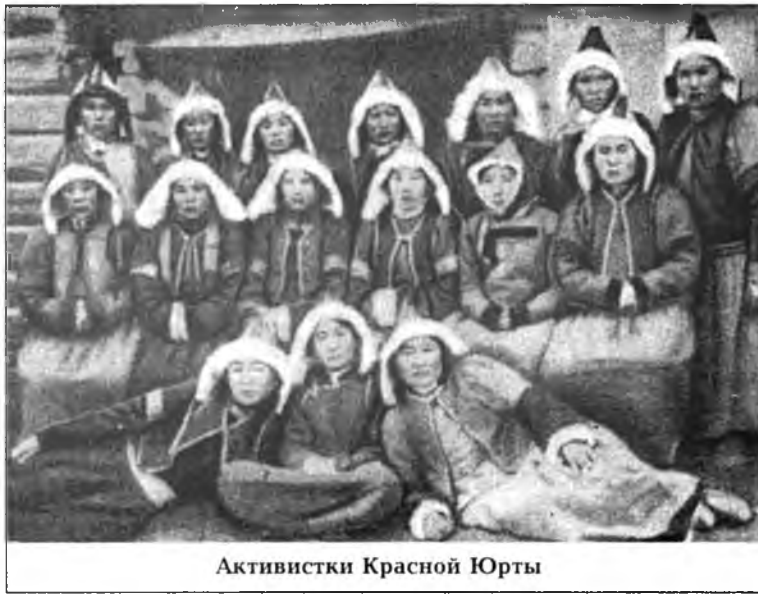
Активистки Красной Юрты

чицей в страховой кассе. И вскоре была принята в подпольную организацию и в члены партии большевиков.