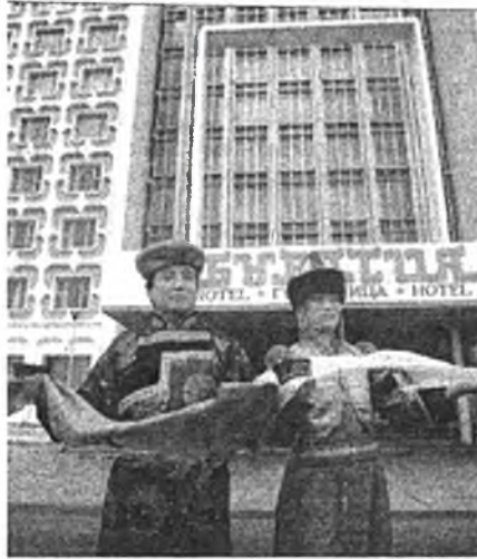
Улаахан уралаа һарада һайрханхайш. һаруулхан һарамнай һахюуһан болонхой. Улаан-Үдынгөө үйлсөөр

Улаан-Үдэ! Буряад оромнай золдоо энхэрээд, Арюун шамаяа ходоодоо магтаал: Улаан-Үдэ, Улаан-Үдэ, Улаан-Үдэ!