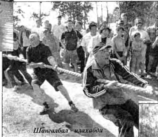
Шангалбал - илахабди

Эршүүлэй дунда финальна уулзалгада Захааминий команда талмайн эзэдтэ нэгэ багаханшые арга боломжо үлөөгөөгүй. Нэгэдэхи партида ганса нэгэл команда наадаа гэхээр - 25:10. Дуратай командаяа хэргээхэ гэхэн харагшад шанга шангаар хашхараад, ооглонод. Хэды тингэбшые, заха холын захааминийхид удаадахи хоёр партинуудые адли 25:22 гэхэн тоотойгоор