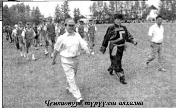
Чемпионууд түрүүлэн алхална