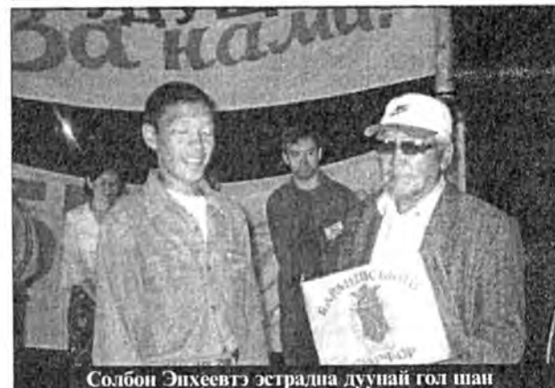
Солбон Энхсөөтэ эстрада дуунай гол шан

дуралхаа. Тингэжэ нютагайнгаа түүхэ, нютагаа эгээл бэрхээр Ульдэргын, Мужыхын ба Тэлэмбын команданууд хамгаалжа шадаа. Экологическа талаар ажал ябуулагдажа байһанаа Тужынка, Ульдэргэ, Нархата (My generation-«Мос поколение») шаламар бэрхээр хөөрөө.