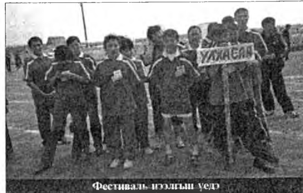
Фестиваль нэгэлгш үедэ

Иимэ элидхэлнүүдые команда бүхэн бэлдэжэ, нютаг тухайгаа, экологическа ажал тухай олоной анхаралда