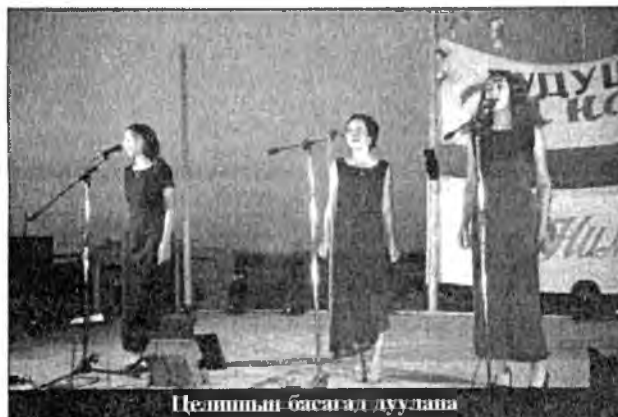
Целиннын басагал дуулаһа

Хоёрдохы үдэртэ эстрада дуу гүйсэдхэгшэд мурьсөөнэ