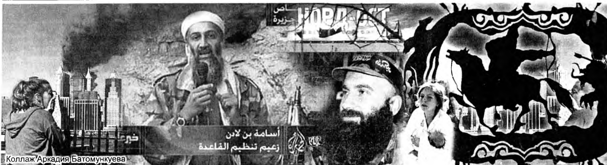
Коллаж Аркадия Батомункуева

Собственно, борьба с международным терроризмом имеет давнюю историю. И можно утверждать, что долгое время Запад вел эту борьбу в одиночестве. В эпоху соперничества двух сверхдержав Советский Союз, естественно, на словах осуждал террористов из числа левачих, маоистских элементов, позже из радикальных мусульманских организаций. На деле же спецслужбы соцстран опекали этих террористов, видя в них неких пособников в антиимпериалистической борьбе.