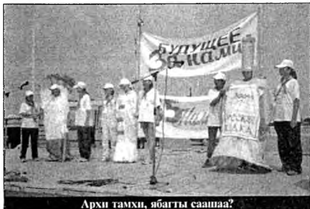
Архи тамхи, ябагты саашаа?