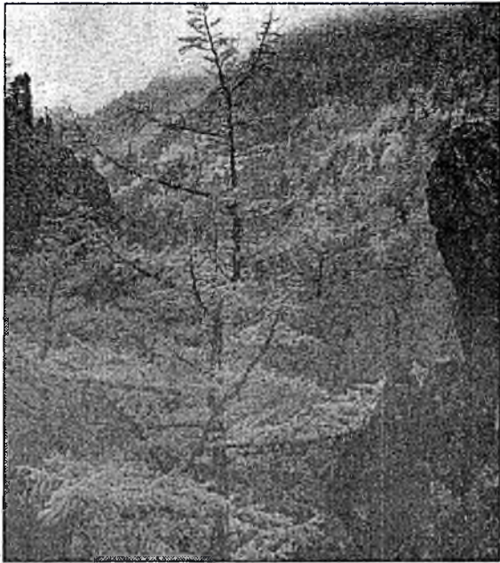
кочегар. - Нэгэ хэдые үгл даа. Углюөгүүр болотор үдэ.

- Тамхияа залал даа. Би яараад, хахадаа намганһаа нууһаар байтараа, тамхияа мартажархөөб, - гэнэ