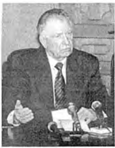
Россин экономика хүүсэ шадалые арьбадхалгада горитой хубитаяа оруулха бшуу.

Тиймэһээ экономическа ургалта тухай хэлэхэдэ, манай минерально-түүхэй эдэй үндэһэ нуури, тэрэнэй хүгжэлтые, ашагта малтамалнуудай хэбтэшэнүүдые ашаглагы хараада абадаг байнабди. Мүнөө Хиагдын ураанай ашагта малтамал хэбтэшые туршалгын промышленна аргаар ашаглаага хэгдэжэ байнхай. Ойрын 4-5 жэлэй туршада тэрэниэ эдэбхитэйгээр ашаглажа захалхабди. Тэрэ гансал манай бэшэ, харин