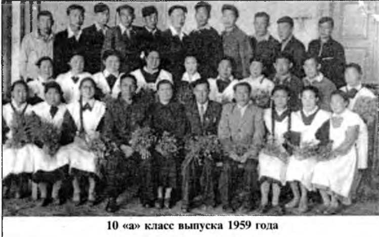
10 «а» класс выпуска 1959 года