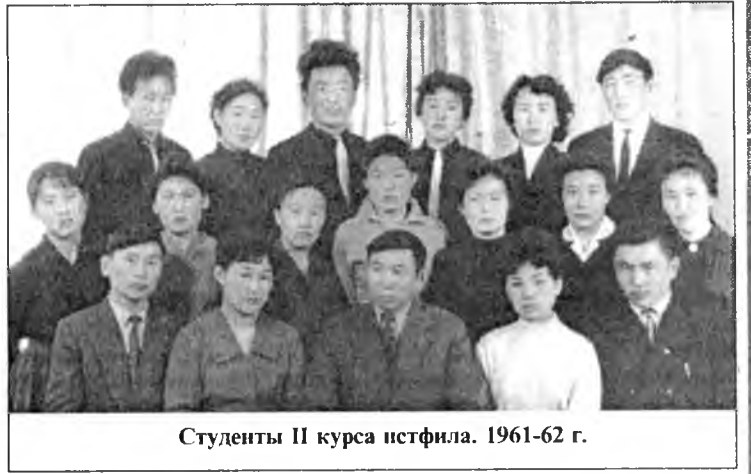
Студенты II курса истфила. 1961-62 г.

«Улаан наран холо гү, Ургахамнай тэндэ хүртэр. Дулаан нажар мүнхэ байһай, Мүнхэ ногоон һуухамнай».