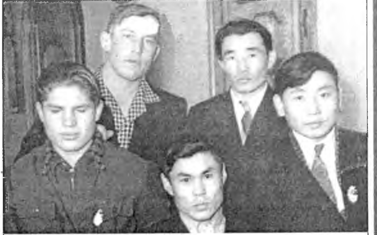
Делегаты Тунки на областной комсомольской конференции. 1960 год.

ХОМХОЙ НАНААН Далан хэлэтэй болоһондол Дайдын ногоо шагнаархан, Далайн далайн сабшахадам Шэбэнэн, шэбэнэн хэлһэншүүл: