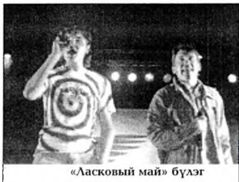
«Ласковский май» бүлэг

зорилготой «Поезд «Энергия жизни - будем жить!» гэнэн бүхэроссин хэмжээн үнгэрхэн амаралтын үдэрнүүдтэ Улаан-Үдэ хүрээжэ эрбэ. Тус поезд Мурманск хотогоо Находка зорино. Түмэр харгыгаар ябажа, 70 гаран станцинуудта поезд зогсолго хээ. Харгы дээрэнэ ушархан бүхы томо хотонуудта элдэбин хэмжээ ябуулгануудые эмхидхэнэ.