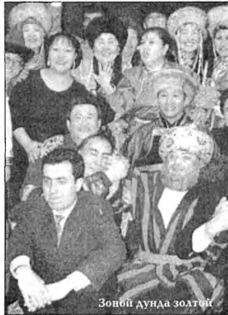
Зоной дунда золтой