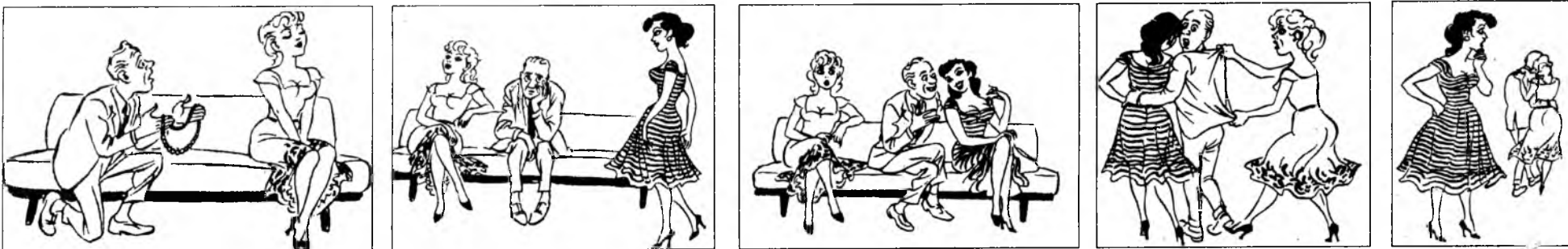
«Шог зугаа» гэхэн но. Ноо.