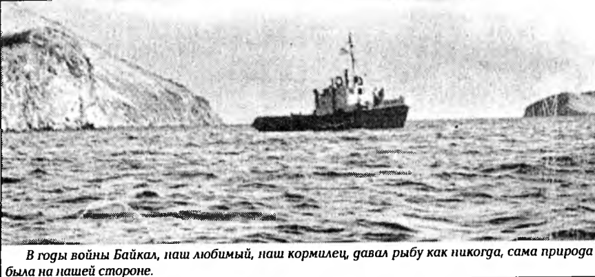
В годы войны Байкал, наш любимый, наш кормилец, давал рыбу как никогда, сама природа была на нашей стороне.

Мои детские и юношеские годы связаны с Ольхоном, делами и событиями колхоза им. Кирова довоенного, военного и послевоенного времени.