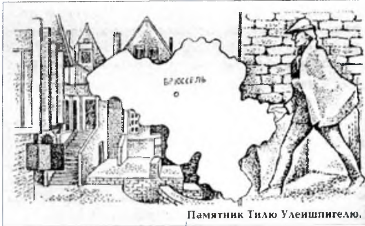
Памятник Тилю Уленшпигелю.

Фландрия находится на северо-западе Бельгии. Ее пейзажи неприветливы и унылы. Плоская низменность, реки и каналы