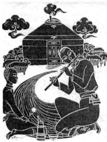
Хүгжөөһэн галдань Хүхэл зогдорто арсалангайн Бисман бурхан хүлэглэбэ ээ!

— Газар уһан дээрэ тогтобо оо. Галабыень Шагжамуни эзэлбэ ээ. Тэнгэри манан дээрэ тогтобо оо. Түбишень Махаранза эзэлбэ ээ. Галбарагша занган могон Газарай хүйһэнһөө ургаба аа. Галадгага шубуун Дунгал һалаадань уурхайла аа. Гурбан сагаан үндэгыень Хоротон мангас хоробо оо. Гулдыгаад хэбтэнэн бэеыень Гэсэр богдонь хараба аа. Гурил агли мяхыень Чингис богдонь зооглобо оо. Сүмбэр уулын орой дээрэ Тэнгэри, наран номаглаба аа. Һүн галайн оройһоо Сандаалай галынь хүгжэбэ өө.