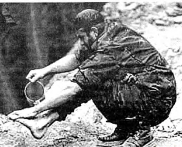
Два сапога - не пара

- Не, ну пап! Ну почему солнце и светит, и греет, а луна светит, но не греет, а? - Сынок, оставь папу в покое, не видишь, ужинаю! Не мешай! - Ну па-а-ана! Объясни! Вот солнце светит и луна тоже светит, солнце греет, а луна нет! Ну почему??? - Ну, сынок, ну так повелось! Ну почему мы, например, руки моем, а ноги нет? - Смотри. Винни, тут художник мой портрет нарисовал! - Да... А почему ты в разобранном виде, и части пронумерованы? - Это мясник, он так видит! Усталый, пьяный в стельку муж возвращается вечером домой в свою квартиру на 18 этаже и застаёт жену «с поличным» в постели с любовником. Берет обалдевшего любовника за шкуру, выбрасывает его в окно и кричит: - Козел, еще раз увижу, убью! Беседуют два браконьера: - Вчера поймал огромного осетра. Закинул его на плечо и иду домой. - Ну? - А тут из-за кустов - инспектор рыбнадзора! - Ну?! - А я осетра с плеча - и в карман!!