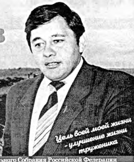
Цель всей моей жизни - улучшение жизни труженика

Выборы в Государственную Думу Федерального Собрания Российской Федерации