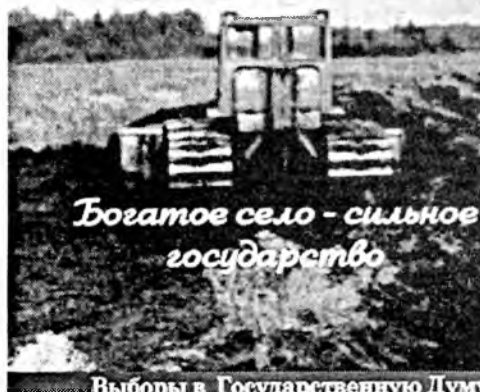
Богатое село - сильное государство