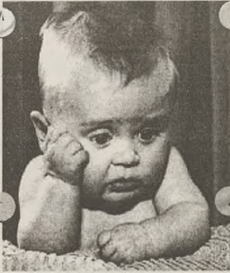
- А годы летят...