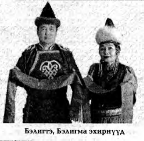
Бэлигтэ, Бэлигма эхирнүүд

Жэргэнэд лэ үнгэржэ байдаг поездын гүйдэлүү, жэгтэй түргөөр ой жэлүүд хубаряад лэ ошонол байна. Мэнэ хаяхан хори хүржэ гү, али хориной богото алханаг үетэй ханшагаа бууралтажа, үри хүүгэдэ гэрлүүлжэ гү, али 50 наһанайнгаа ойн баярыс угтажа байхадань яаха болонол?..