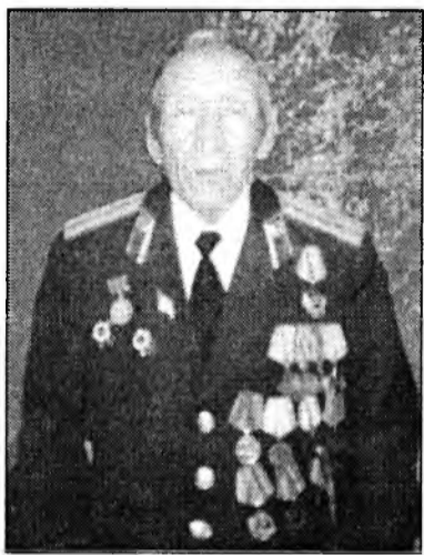
Тогошиевай шүлэгүүд толилогдодог байһан юм. Мүнөө уншагдайнггаа анхаралда «Сасуутан» гэжэ шүлэгиень дурадханабди.

Атар талым адха шорой аяар холуур Аяншалаа зүрхэн дээрэм, байлдаан соогуур Эрын ёһоор харин газар махажа даа, Эхэ нютагай энхэрдэги ойгохол даа.