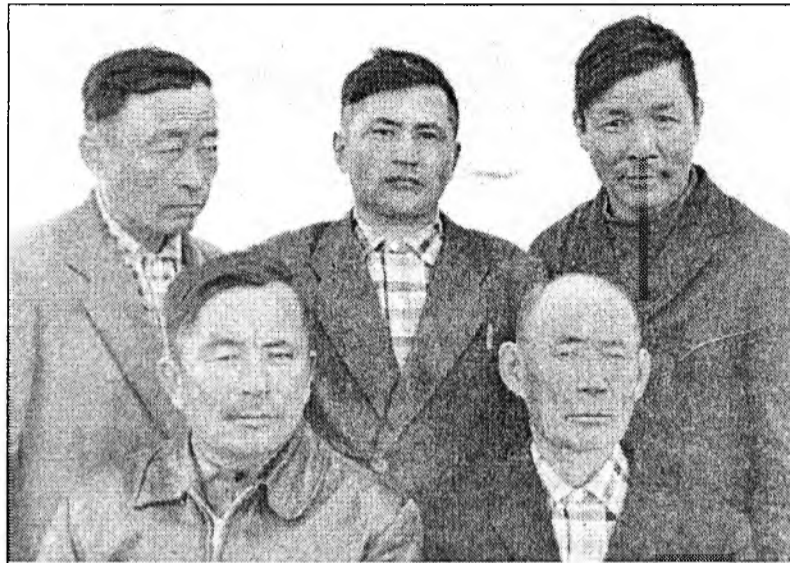
Отважные и сильные сыновья нашего села

Даже страшно сегодня представить, что нет сейчас этого хозяйства, мощного Селенгинского совхоза, одного из ведущих в республике тогда, которое поднимали и развивали всем миром. Не доедали, работали сутками. Развалился СССР, получается все следом развалилось. Все, что мы добывали и достигали потом и кровью, развалено, разворовано. Так ведь и называют: праздник со слезами на глазах! Если спросит внук, где я и что в этой жизни сделал, как ответить? Потрясти только медалями? Но в одном не отчаялся ветеран - это в своей семье.