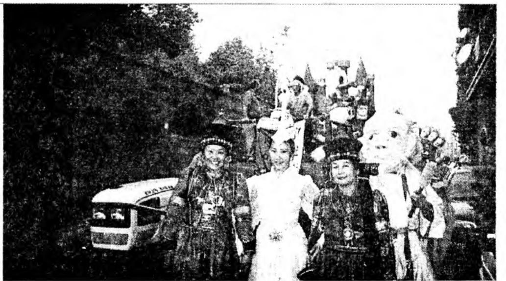
Үзэсхэлэн һайхан Италида «Улгы нютаг» ансамбль айлшалаа