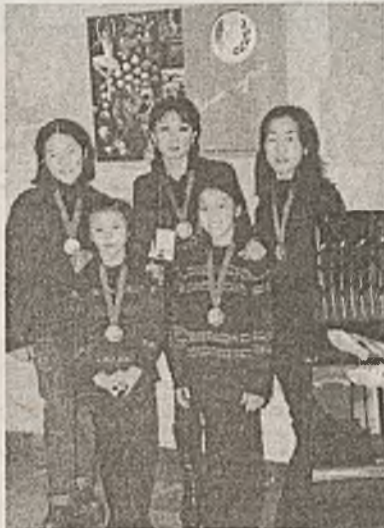
Түлөөлэгшэдэй зүгһөө урилгануудта хүртөө. Тэдэнэй тоодо, эгээл...