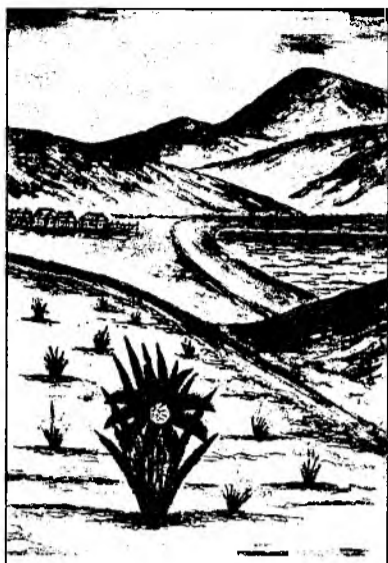
Синий цвeтoк сахилдаг— Синее пламя земли, Сильные сия люди — Символ небесной Шанаа.