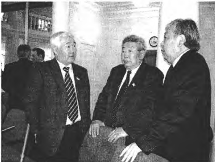
Депутатов Народного Хурала, шедших на сессию, встречал пикет работников образования, здравоохранения ряда районов, обращавшихся к своим избранным принять за-

кон о предоставлении льгот по коммунальным услугам сельским специалистам и о внесении изменений в закон о республиканском бюджете на 2005 год, предусмотрев в нем средства на эти цели.