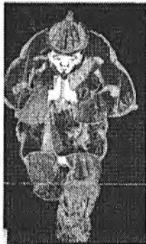
Олон түмэн зонтой хото соо Ори гансаараа ябагчид

Усөөн зонтой хото соогоо Үсэгдээрэй нониние мэдээд абахаш.