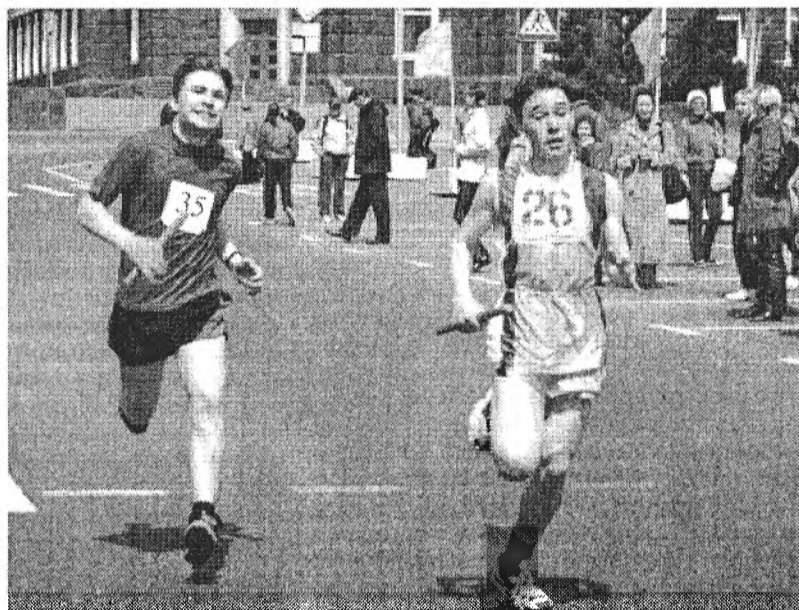
ЗУРАГУУД ДЭЭРЭ: мұрысөөнэй үедэ.