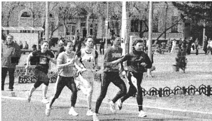
Энэ мұрысөөн Агуу Илалтада зорюулагдаа