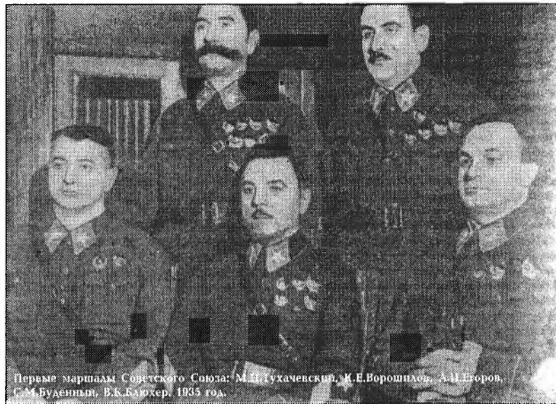
Первые маршалы Советского Союза: М.Н. Тухачевский, И.Е. Ворошилов, А.И. Егоров, С.М. Буденный, В.К. Блюхер, 1935 год.

В августе началась печально известная Варшавская операция, Тухачевский, ошибочно считая, что главные силы противника находятся севернее Буга, сосредоточил свои войска на этом направлении для разгрома их за Вислой. 10 августа армии Западного