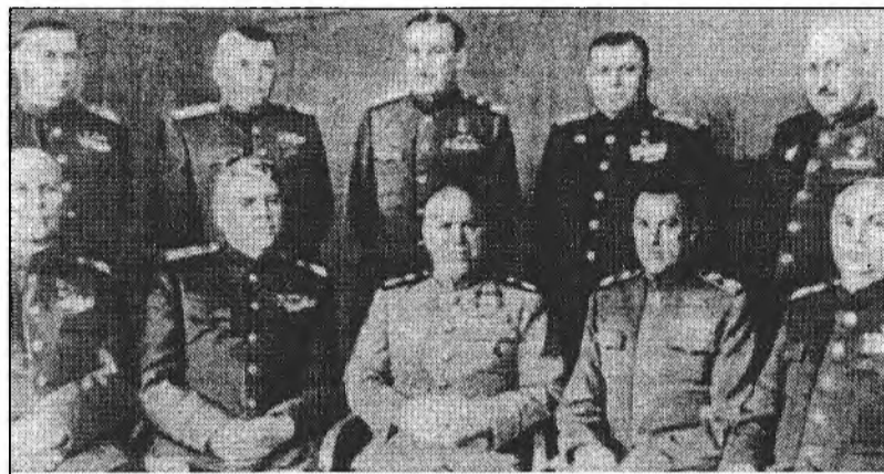
Командующие фронтами на заключительном этапе Великой Отечественной войны. Сидят: И.С.Конеv, А.М.Василевский, Г.К.Жуков, К.К.Рокоссовский, К.А.Мерецков. Стоят: Ф.И.Толбухин, Р.Я.Малиновский, Л.А.Говоров, А.И.Еременко, И.Х.Баграмян.

кадры старшего и среднего звеньев командного состава, то, безусловно, в годы Великой Отечественной войны можно было достичь победы с меньшими жертвами, да и весь ход войны мог быть иным».