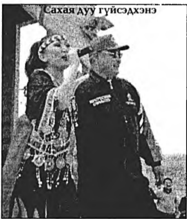
Сахая дуу гүйсэхдэнэ