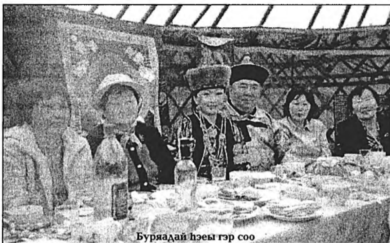
Буряадай нэе гэр соо

Республикнай мэдээжэ «Алтан булаг» ансамбль бэлиг шадабарияа хуульшын концерт нааданда харуулаа. Мүн Саха-Яхадай одон, республикадмай болоһон «Сагаан нара» гэхэн уласхоорондын конкурсын лауреат Сахаяа сугларагшадые баясуулаа. Энэл концертдэ Алтайн, Монголой, Тывагай соёлшод нэръемэ алга ташалган доро концерт наадаа харуулаа.