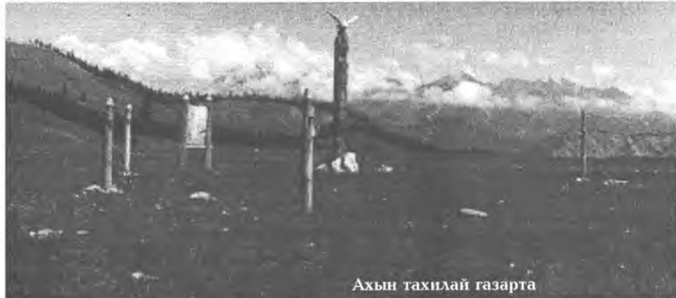
Ахын тахилай газарта