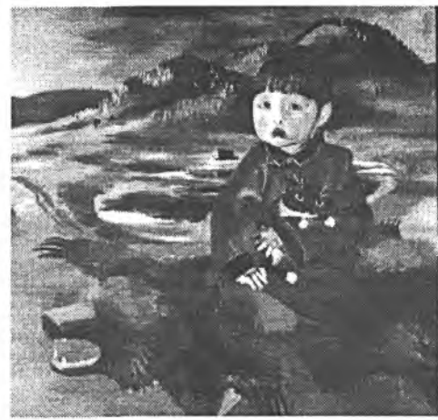
1. Август в Киргизии. 2. Мальчик на медвежьей шкуре.