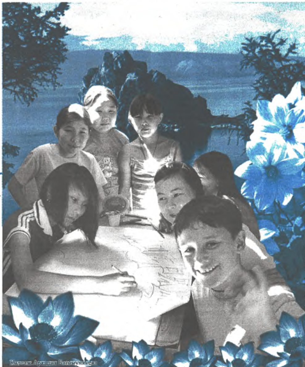
Зунай саг зулгы