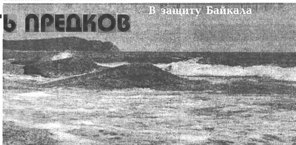
В защиту Байкала

Жизнь, оставшихся в Тибете сяньбийцев и табгачей, была очень нелегкой, и