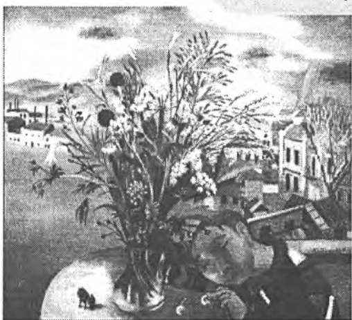
1. Дачница. 2. Райские яблочки.