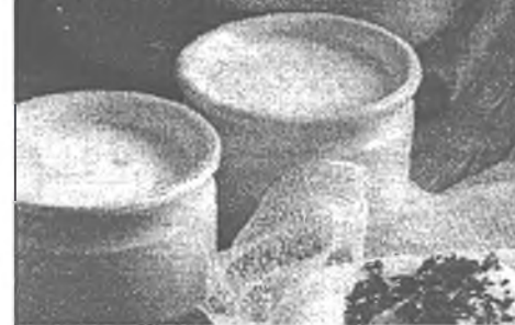
Внимание: апельсиновый сок затрудняет всасывание некоторых антибиотиков!