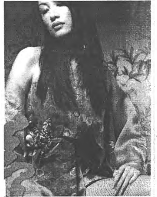
Дых «длинноногих тварей», если мода не пройдет.

Таким образом, мы стоим в преддверии интересного события: страны «первого» мира скоро накроет волна длинноногих красавиц из «третьего» мира. Жены западных деятелей и миллионеров будут рвать на себе волосы, наблюдая, как их мужья не могут оторвать глаз от моло-