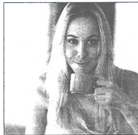
Не забывай лекарство молоком: оно ослабляет лечебную силу препарата

* Пей побольше жидкостей, лучше всего минеральную воду или несладкие травяные чаи (липовый, малиновый, отвар черной бузины). Очень полезны также ягодные морсы.