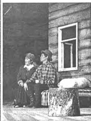
В одном Курумканском районе функционируют 5 народных театров - это уникальное явление не только в Республике Бурятия,

исполнительства, первым шагом на большую сцену.