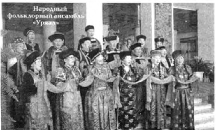
Народный фольклорный ансамбль «Уржал»

Гушаад онуудай эхээр, сүлөөтэ болоһон хүн зомнай уран бэлигээ хүгжөөжэ, хайн дуранай бүлэгүүд бии болгогдохо үеэр Искусствын түбэй байшан республикадамнай нээгдэжэ, удангүй Буряад-Монголой арадай уран бэлигэй байшан болгон хубилгагдаа бэлэй. 1929 оной республикымнай Наркомпросой Коллегиин зүблөөн дээрэ бэелүүлэгдэхэ гол хэмжээ ябуулгануудай тоодо Искусствын түбэй байшан байгуулга шухала гэжэ тэмдэглэгдэн байна. Тэрэшлэн 100 гаран уран хайханай коллектив бии болоһон байгаа. Тэдэндэ туһалха үүргэтэй республиканска байшангай түрүүшэ директорээр М.А.Ермаков томилогдоһон юм.