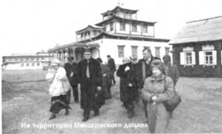
На территории Ишбаганского дацана

ЗУРАГУУД ДЭЭРЭ: РЦНТ-гэй баяр ёһололой үгэрнүүдэй.