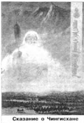
Сказание о Чингисхане