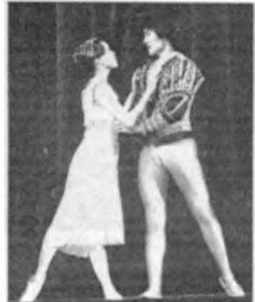
По совершение их судьбы ужасной вражда отцов с их смертью умерла».

«Из чресл враждебных, под звездой зловещей, Любовников чета произошла