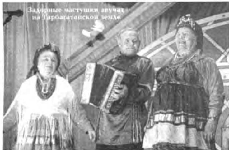
Защитные частушки звучат на Тарбагатайской земле