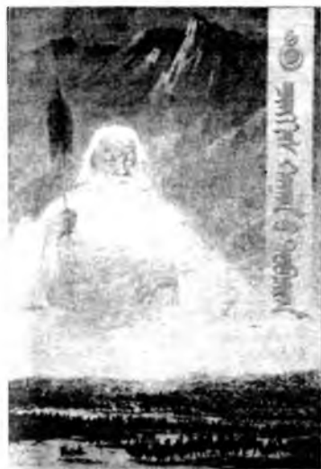
Орчун исполнительной власти Ханской Монголии

Любое государство, будь оно хоть вчера созданным образованием, должно иметь свой орган государственными полномочиями, орган исполнительной власти, которая может носить любой характер, иметь любую форму. И Ханская Монголия должна была иметь свою власть.