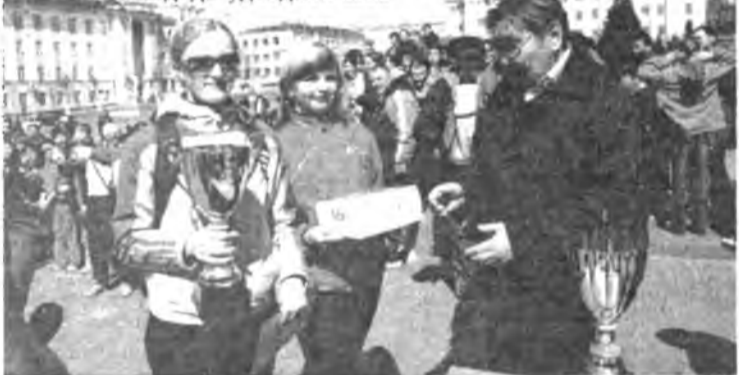
Технологическа университедэй комангада удаадахи шан