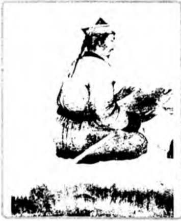
Зай, һанаһуу. Толгойм соорхой болошоол даа...

- Намда интервью үгэгты (блокнот, ручка гаргана). Ила- лтын найр ойртоо. Дайнда ябаһан ябадал сооһоонь эгээн һонин ушарнуудые хөөржэ үгыт даа. Гансал тагтай ушарһан.